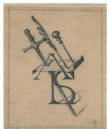
AMICI DI LEONARDO SCIASCIA www.amicisciascia.it