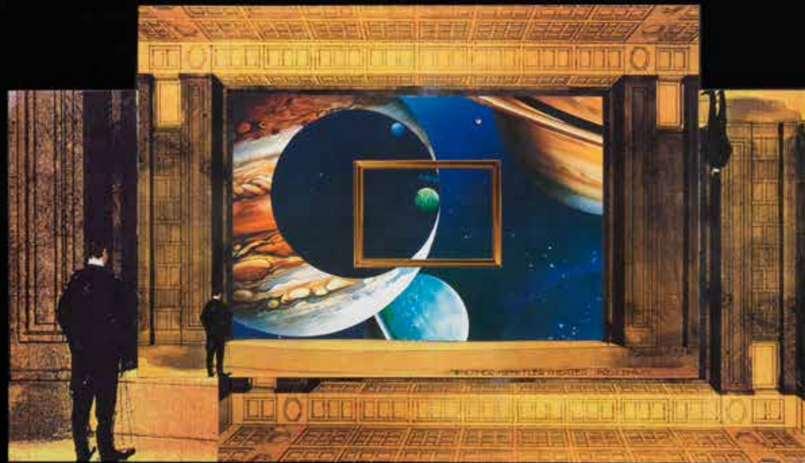
GIULIO PAOLINI, Senza titolo, 1990, collage su carta nera 70 x 100 cm (Collezione privata Firenze)