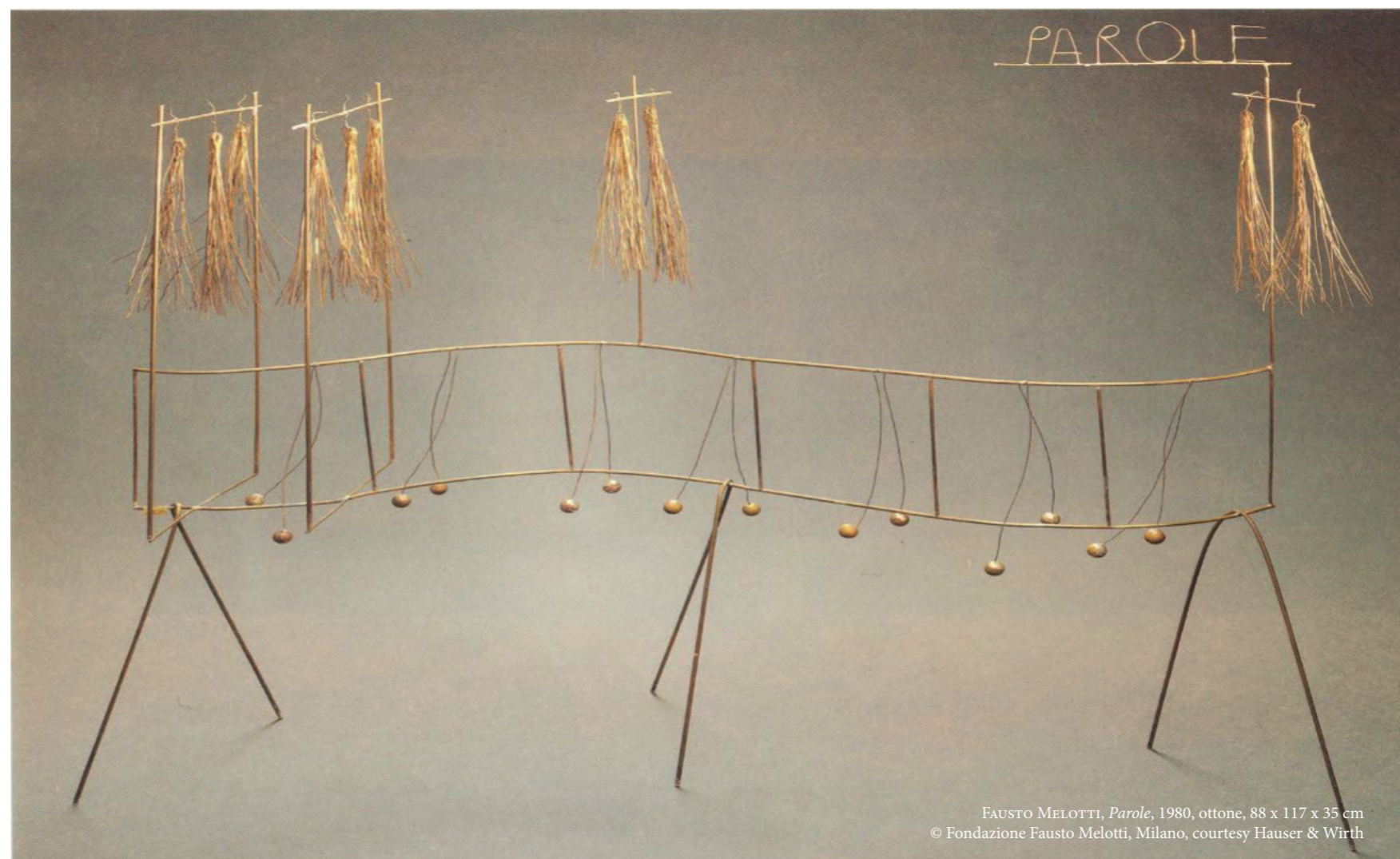
FAUSTO MELOTTI, Parole , 1980, ottone, 88 x 117 x 35 cm © Fondazione Fausto Melotti, Milano, courtesy Hauser & Wirth